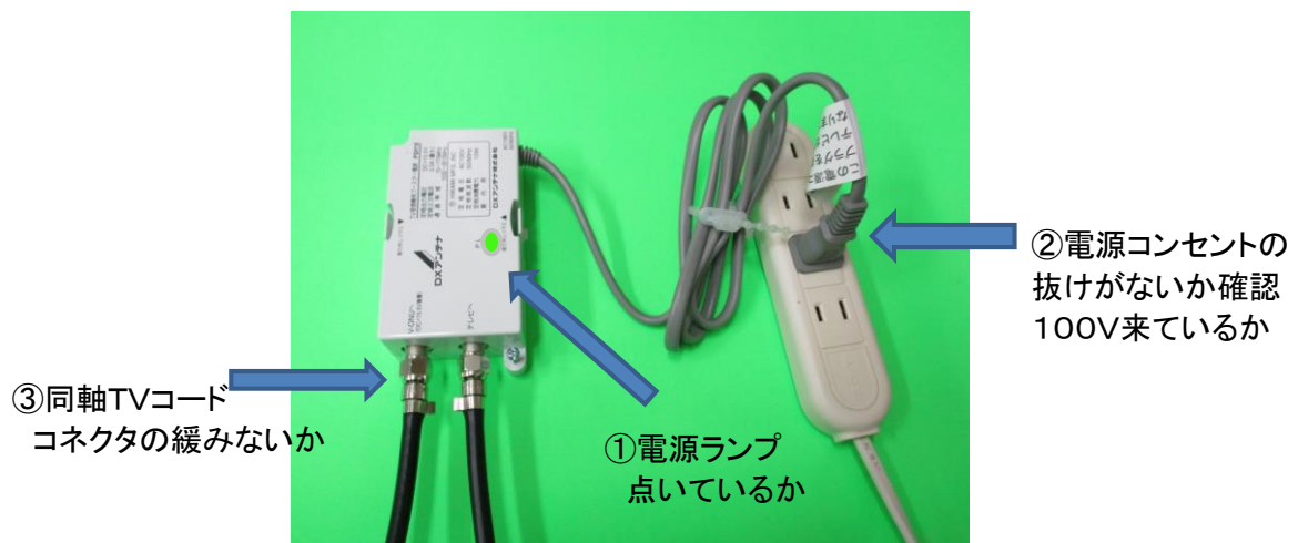
DXアンテナ V-ONU電源供給器(PS)